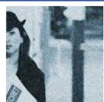
Name: Stadtspionin Wien

Ein Blick hinter die Kulissen gefällig? Die StadtSpionin schreibt, denkt und postet Fotos auf Facebook. Werden Sie ein Fan der StadtSpionin, einfach auf das Banner klicken und anmelden.